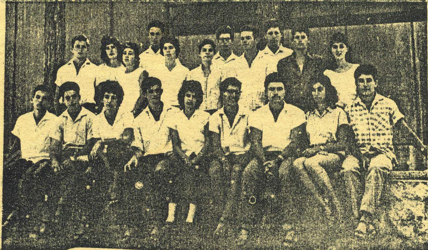
מקדש לקבוצת שבליים בסיומת את האוסף התנ"כי.