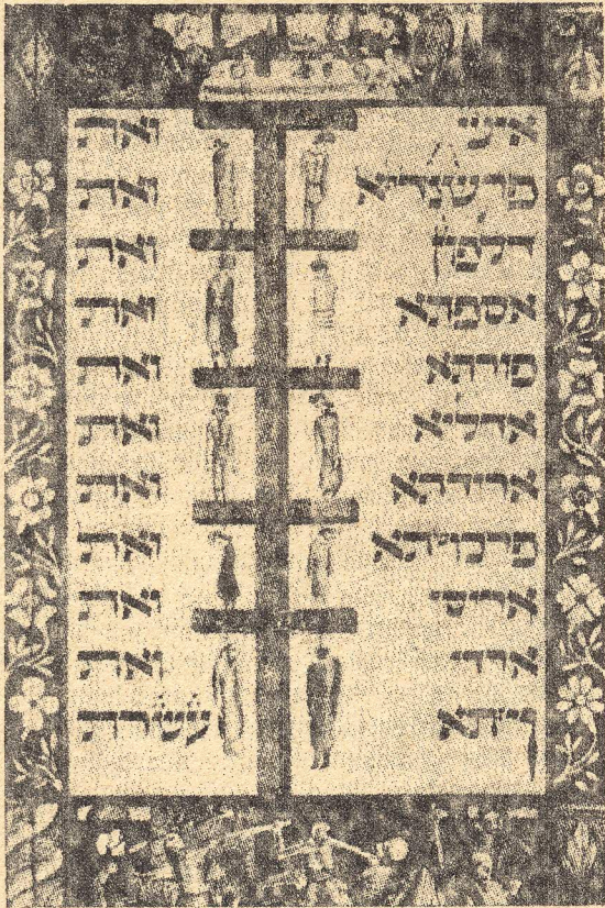
„משרת בני המן“ במגילה מצוירת, איטליה המאה ה־11

הגיע הזמן לכם לגלות מדוע מתאים לי פרופסור להיות אולי יראה זה בעיניכם מוזר הכל זה בזכות היותי כה מפורז.