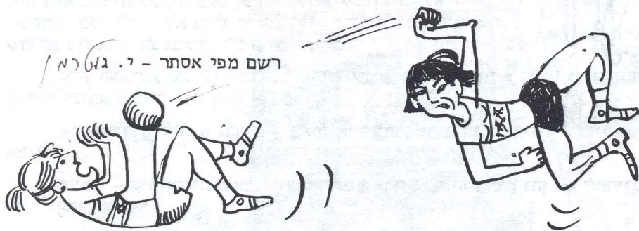
רשם מפי אסתר - י. גוטמן

לגבינו - היתה זו נסיעה מועילה ומהנה מאד.