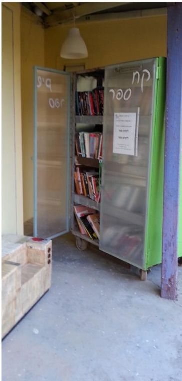
(צילום: עדנה גולן)