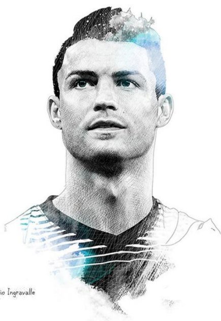
Portrait by: Sergio Ingrassia