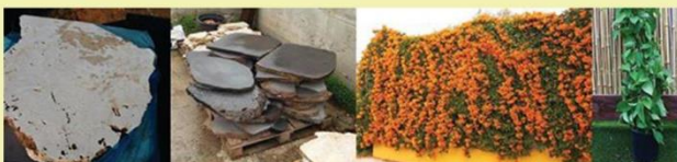
*מהרו להזמין - המבצע עד גמר המלאי

אדריכל אמן בזלת אנוסר - 60 ש"ח ליחידה צצים להסקה 1 קוב - 250 ש"ח איסוף צמחי 300 ש"ח הולכה עד הבית שתילי אורנית לזוהבת 1 מ' גובה - 40 ש"ח ליחידה רוסק צץ אקליפטוס - 250 ש"ח לקוב