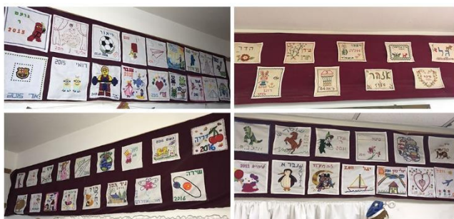
מסורת מקומית ייחודית!!! החלה בשנת 1984 ומאז שומרת על קיומה (מוזמנים לבוא למצוא את הרקמה שלכם)