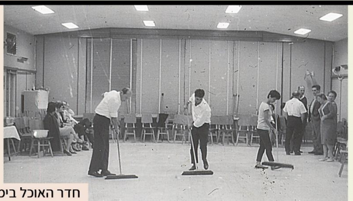
חדר האוכל בימים הטובים שלו